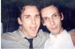
table etc. Il ne reste plus que nos amis respectifs (moyenne d'âge : 25 ans). Nous ouvrons les cadeaux et remercions tout le monde.